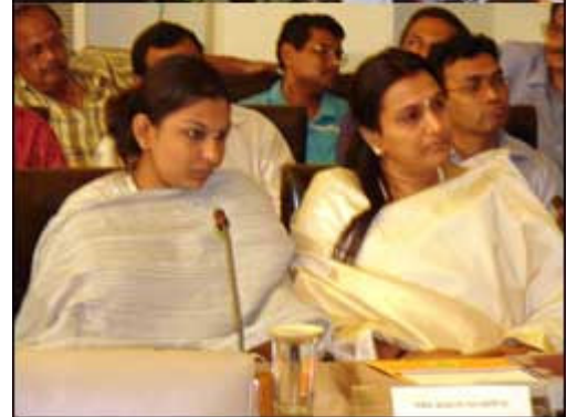
ପୁରୀ ବେଳାଭୂମିରେ ଆନ୍ତର୍ଜାତିକସ୍ତରୀୟ ବିଶ୍ୱବିଦ୍ୟାଳୟ ସ୍ଥାପନ ପାଇଁ ବେଦାନ୍ତ ସହ ବୁଝାମଣାପତ୍ର ସ୍ୱାକ୍ଷରିତ ।