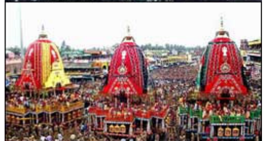
ଆଜି ପବିତ୍ର ବାହୁଡ଼ା ଯାତ୍ରା । ପୁରୀରେ ଭକ୍ତଙ୍କ ଭିଡ଼ ଲାଗି ରହିଛି ।