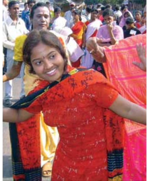
ଏଡ଼ିଏ ସଚେତନତା ଉଦ୍ଦେଶ୍ୟରେ ରାଜଧାନୀ ଭୁବନେଶ୍ୱରରେ ରୂପକୀର୍ତ୍ତୀଙ୍କ ନୃତ୍ୟ । ଅନ୍ୟାନ୍ୟ ଖବର