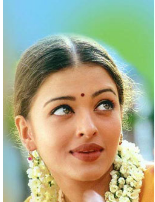
ଲଣ୍ଡନର ଲର୍ଡସ ଗ୍ରାଉଣ୍ଡରେ ଯୁରୋପିଆନ ଯୁନିୟନ ପକ୍ଷରୁ ଯୁଦ୍ଧରୀ ଏିଶ୍ୱର୍ଯ୍ୟା ରାୟ ଓ ଜ୍ୟାକି ଚାନ୍ସକୁ ସମ୍ମାନିତ କରାଯିବ ।